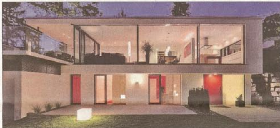
Klare Formensprache und Stromerzeugung durch Solaranlagen auf dem Dach machen das Fisch-Haus in Warmbronn zum Plusenergie-Gebäude.

Beim Tag der Architektur am Samstag, 23. Juni , ist der Treffpunkt um 14 Uhr am Nordeingang des Sindelfinger Rathauses an der Wolboldstraße. Zu Fuß geht es in die Arztpraxis Dr. Sigel, bevor Busse nach Warmbronn zum Plusenergiehaus fahren. Die Fahrt geht weiter zur Bücherei nach Rutesheim und zur Pestalozzistraße nach Leonberg . Die Rückkehr nach Sindelfingen ist um 14.45 Uhr geplant. Anmeldungen bei Holger Schlichtig unter Telefon 0 70 31 / 41 00 80.